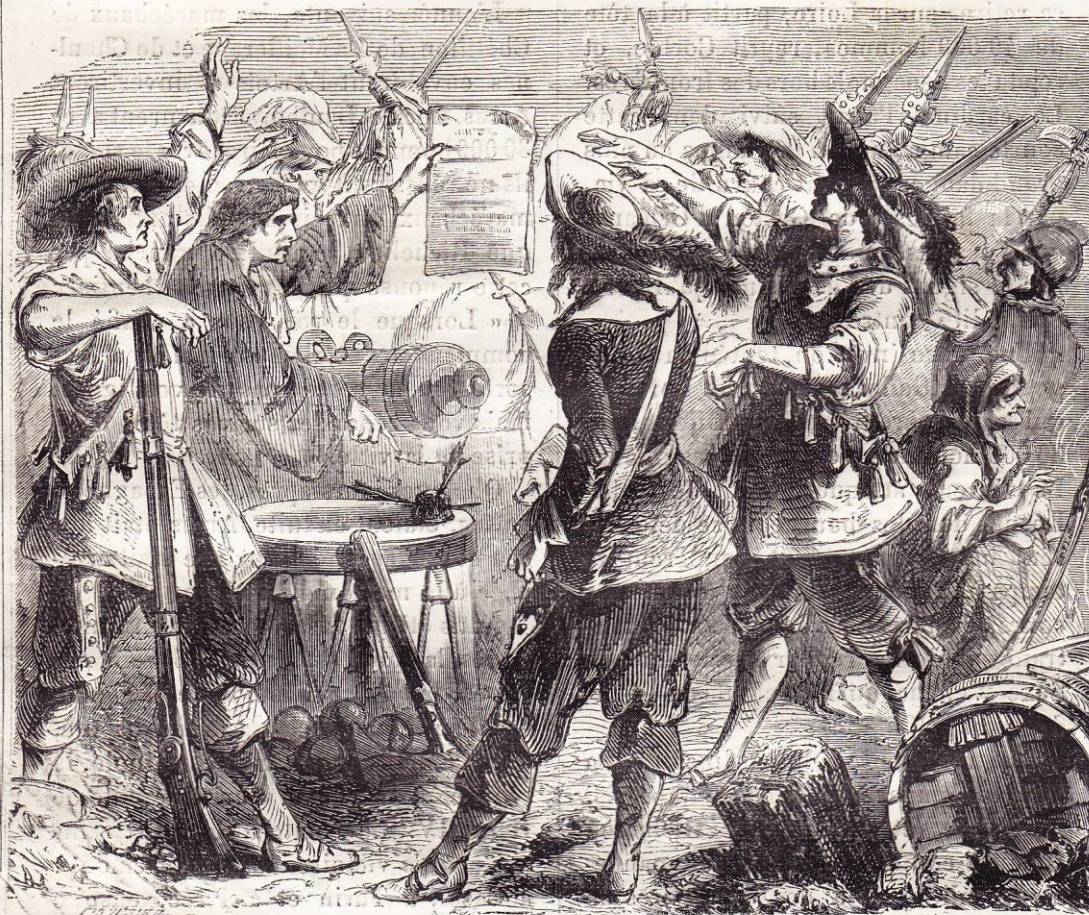
Siège de Saint-Jean-de-Losne (2 novembre 1636):

L'empereur d'Allemagne n'était pas plus favorisé que nos autres ennemis. S'il avait respiré après la bataille de Nordlingen et la défection de l'électeur de Saxe, qui avait forcé les Suédois à reculer jusqu'en Poméranie, il avait été deux fois battu par Banner, qu'on