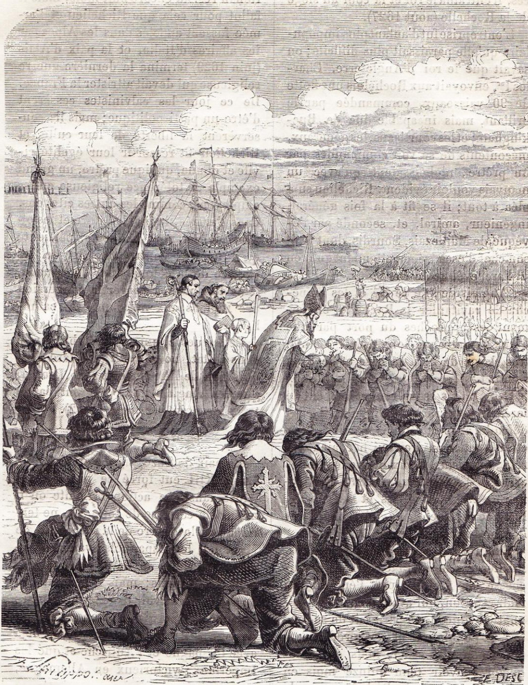
Les mousquetaires au siège de la Rochelle (1627).

faire plus à son aise, il signa avec l'Espagne le traité de Mençon qui lui laissait la disposition de toutes ses forces.